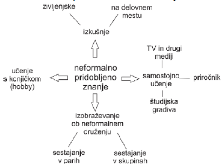
Slika 1: Kako lahko pridobimo neformalna znanja:

Z nacionalno poklicno kvalifikacijo posameznik tako dokazuje usposobljenost za opravljanje določenega poklica.